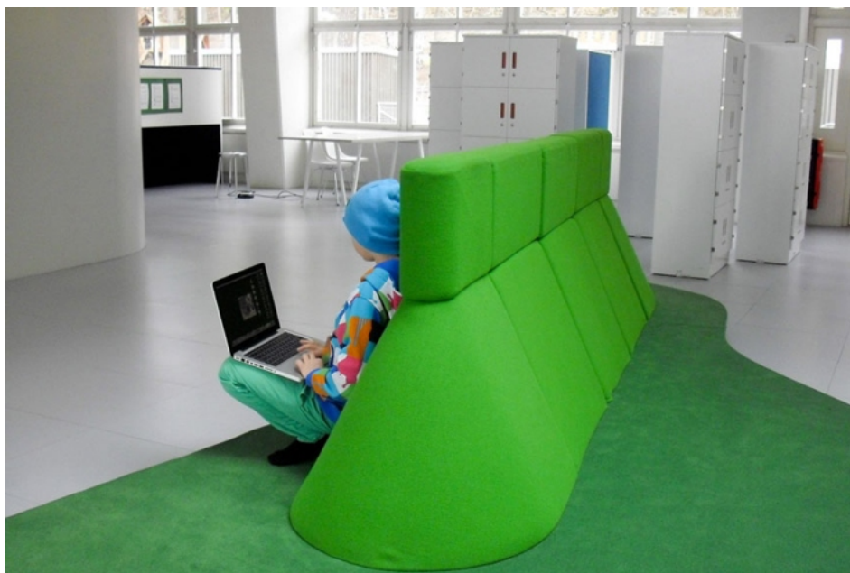
Het klaslokaal van de toekomst, geïnspireerd op Vittra-scholen in Zweden.

Vier tienerschooljaren lijken sterk op brede eerst graad die minister van Onderwijs Hilde Crevits wil invoeren